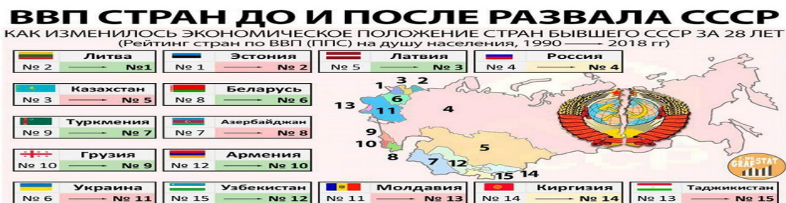
ИЗМЕНЕНИЕ ВВП (ППС) НА ДУШУ НАСЕЛЕНИЯ С 1990 ПО 2018 ГГ, $