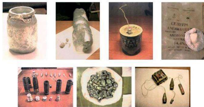
Фотографии взрывных устройств и их компонентов, изготовленных из штатных боеприпасов, аммиачной селитры и алюминиевой пудры, изъятых в процессе оперативно-розыскных мероприятий оперработниками ФСБ России

ПОМНИТЕ: внешний вид предмета может скрывать его настоящее назначение. В качестве камуфляжа для взрывных устройств используются обычные бытовые предметы: сумки, пакеты, свертки, коробки, игрушки и т.п.